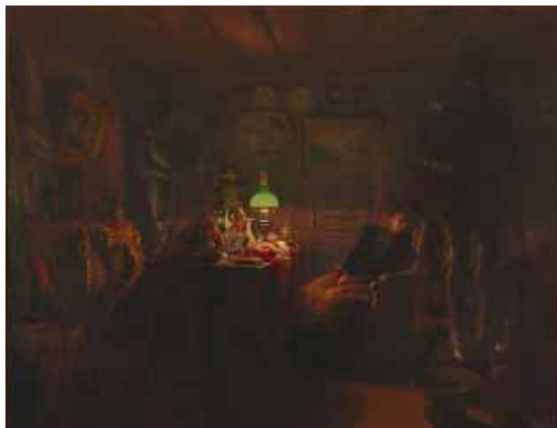
Victor LECOMTE, La fille de l'antiquaire endormie , huile sur toile, 1898, musée de Saint-Maur.