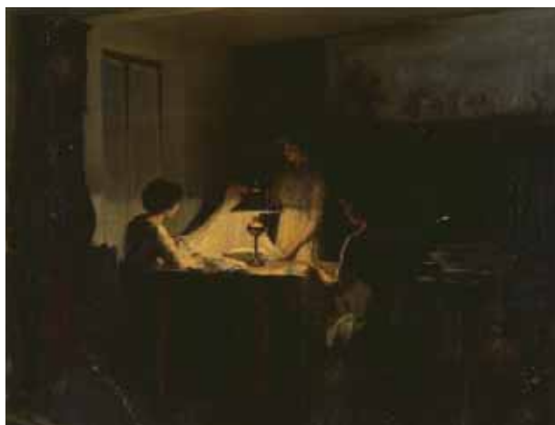
Marcel RIEDER, Trousseau , huile sur toile, 1913, mairie de Cachan.