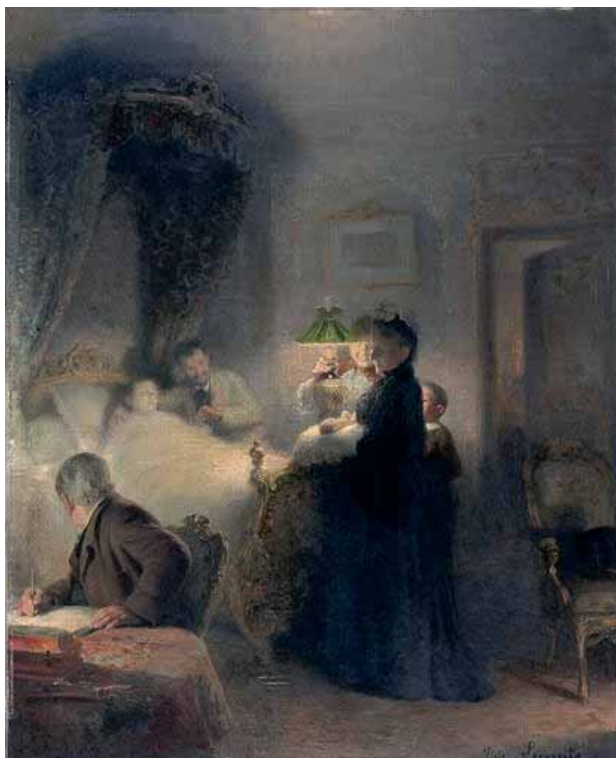
Victor LECOMTE, La naissance , huile sur bois, 1892, musée des Beaux-arts de Nantes.