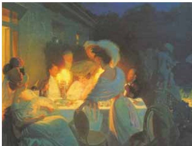
Henry BOUVET, Souper, effet de lampe , huile sur toile, 1908, collection du musée de Bourgoin-Jallieu.